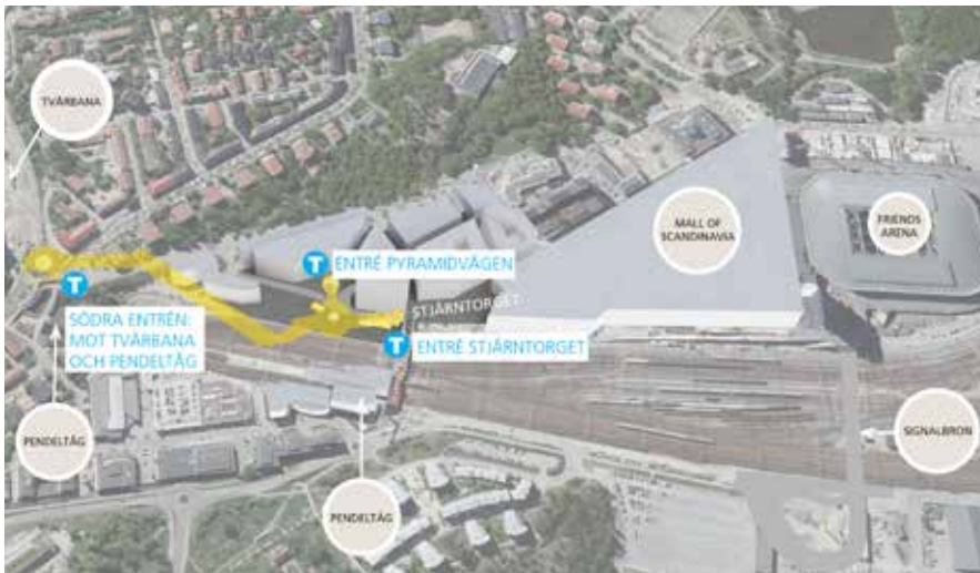
Arenastaden. Tre entréer planeras för att nå bostäder, service och kommunikationer på ett smidigt sätt.