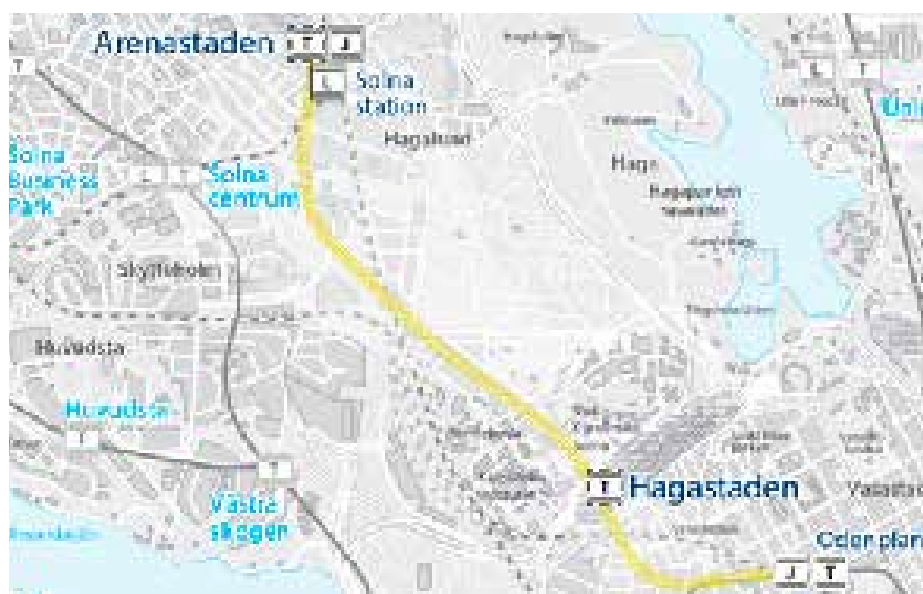
Gula linjens sträckning från Odenplan till Arenastaden.

Genom att de som reser med Gula linjen stiger av och på tunnelbanan på den befintliga plattformen vid Odenplan, blir bytet till Gröna linjen söderut enkelt och smidigt för resenärerna. De behöver bara gå över plattformen.