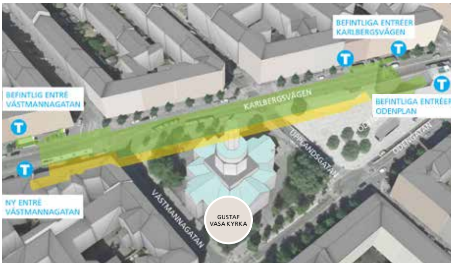
Odenplan. Den nya plattformen placeras söder om den befintliga plattformen.